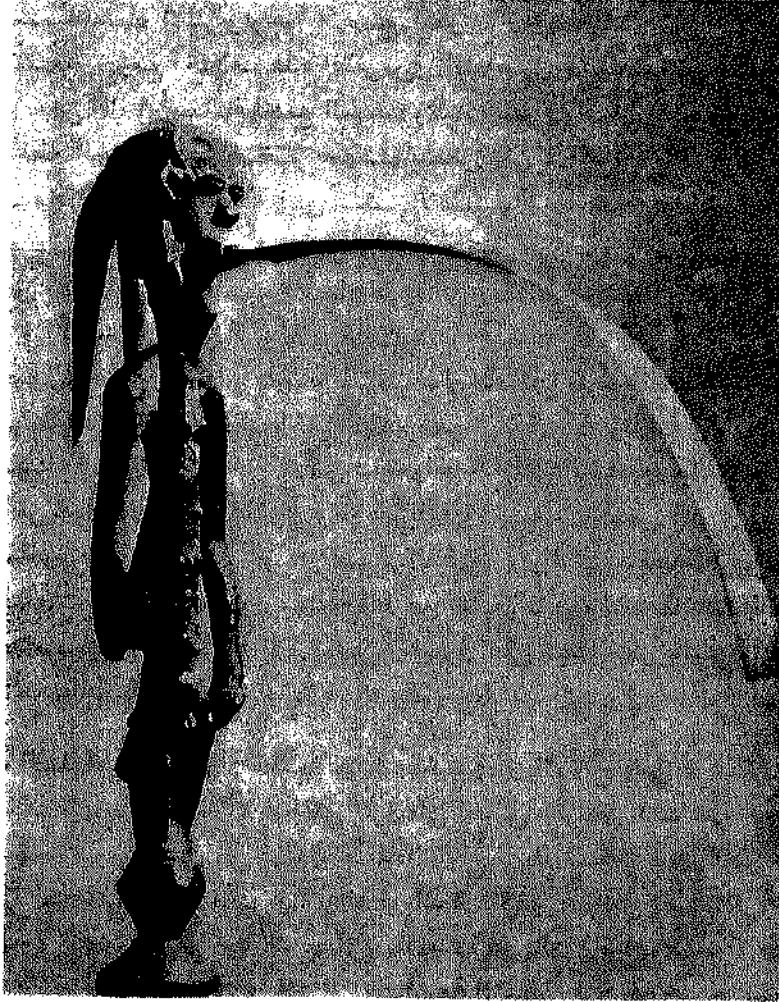
المبالغة في ابراز طول اللسان كوسيلة سحرية للتمكن من الخطابة في مجالس القبيلة ، وبالتالي احتلال مركز ممتاز في التنظيم السياسي القبلي .

والمبدأ نفسه يصدق على موقف البدائيين من الكون ورغبتهم في التحكم فيه لتحقيق نتائج تتفق ومطالبهم الخاصة . فمن طريق السحر التشاكلي الذي يعتمد على الرمزية القائمة على التشابه يستطيع الرجل البدائي ان يتحكم في الجو والمطر وحرارة الشمس والقيوم وحركة النجوم والكواكب بل وان يسخر القوى الروحية الكامنة فيها لخدمة اقراضه الخاصة . وربما كان افضل