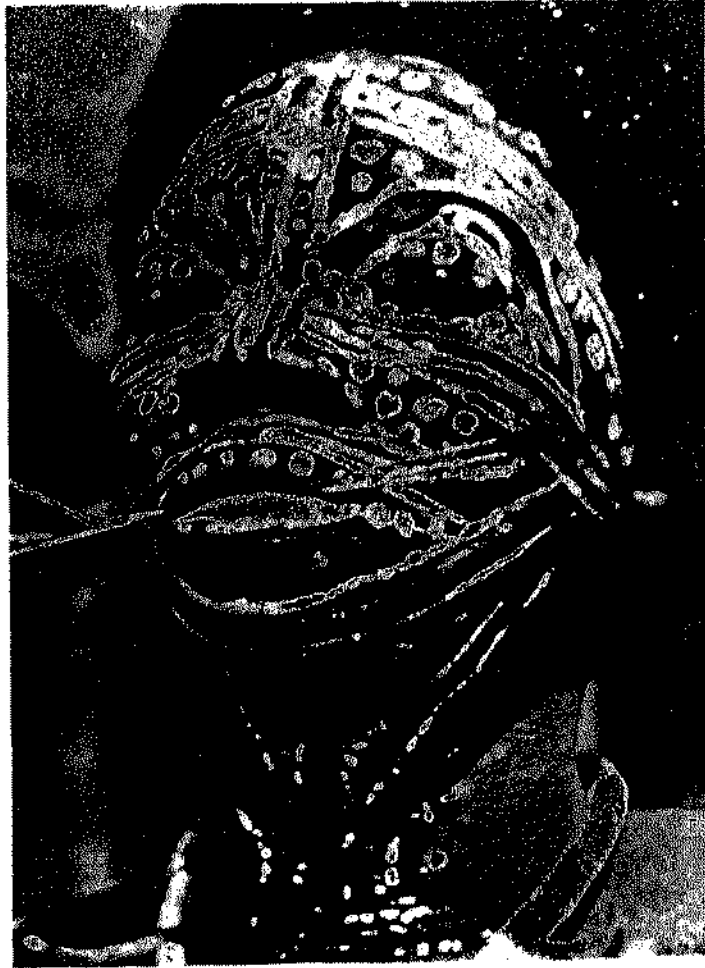
في الحفلات الشعائرية - وبخاصة المتصلة بعبادة الاسلاف او الشعائر الطوطمية - يصبغ رجال القبيلة ( والسحرة منهم على الخصوص ) وجوههم باصباغ مختلفة ترمز الى الطوطم الذي يتبعونه .

وفي هذه الأمثلة ما يكفي لتوضيح المقصود من المبدأ العام الذي يحكم موقف الانسان البدائي من الكون والذي يتمثل في محاولة فرض ارادة البدائيين على الظواهر الكونية تحقيقاً للنظام