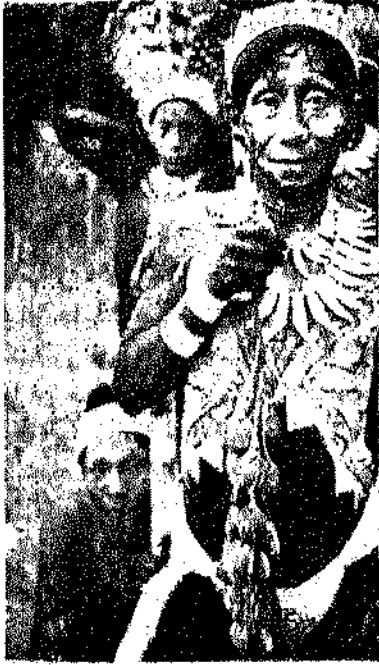
الشامان عند بعض قبائل الهنود الحمر وهو يجمع بين وظائف رجل الدين والساحر .

وللبدائيين وسائل كثيرة لتحقيق ذلك ، والواقع ان الجانب الاكبر من الممارسات والطقوس الشعائرية التي تمارس في المجتمع البدائي والتي يطلق عليها الأنثروبولوجيون اسم السحر أو الدين يهدف في المحل الاول الى تسهيل الحياة هناك وتمكين الناس من السيطرة على الظواهر الكونية ومظاهر الطبيعة او على الاقل تنسيق العلاقات بين الانسان والكون بما يتفق آخر الامر وصالح الناس انفسهم وخير المجتمع . ويؤلف السحر والدين في المجتمع البدائي جزءاً مما يمكن تسميته بالنسق الايديولوجي ideology ، على اعتبار ان الايديولوجيا - في هذا الصدد - هي نسق المعتقدات التي تفسر طبيعة علاقة الانسان بالكون والممارسات الشعائرية التي تتصل بهذه المعتقدات . ومن هذه الناحية ايضا يعتبر النسق الايديولوجي نوعاً من الاستجابة للحاجة التي يشعر بها الناس لتحديد معنى وجودهم في الحياة . ولذا يحاول النسق الايديولوجي ان يجد تفسيراً لأصل الانسان وأصل الكون وتقريب الحاضر الى الافهام ورسم صورة واضحة للمستقبل (٢٧) .