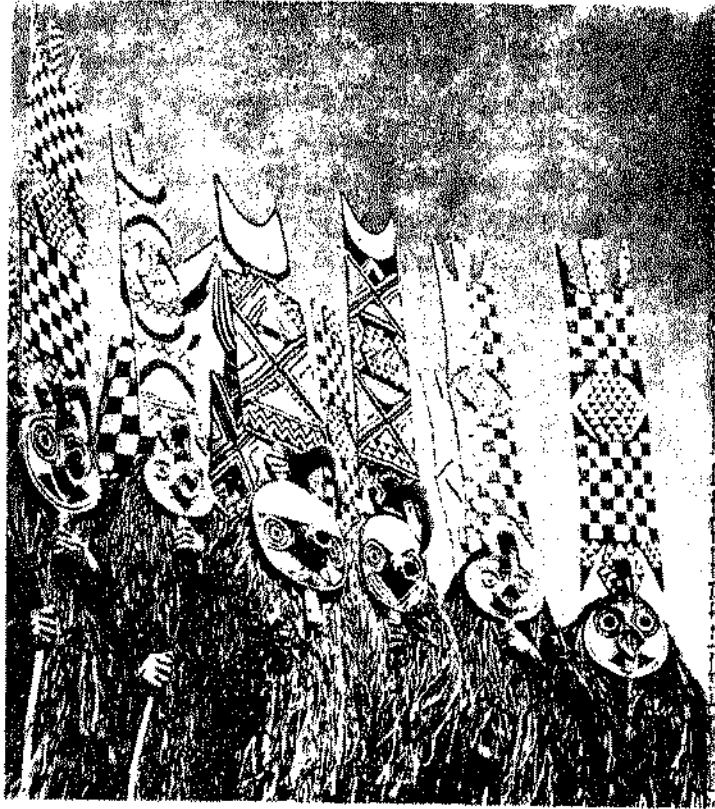
رجال يلبسون القنعة وملابس تمثل طوطمهم القبلى .

واذا كانت عبادة الاسلاف تقوم على عبادة الانسان لنفسه فان الطوطمية تقوم على عبادة الحيوانات وتقديسها ، ولا بد من التمييز هنا بين ثلاثة مظاهر مختلفة من عبادة الحيوان ، الأول منها هو عبادة الحيوان في حد ذاته وبطريق مباشر، والثاني هو عبادة الحيوان بطريق غير مباشر في شكل صورة أو صنم أو تمثال يعتبر مكانا يحل فيه احد الالهة ، أما المظهر الثالث فهو احترام الحيوان كطوطم أو على اعتبار انه يمثل الجد الأول للعشيرة . (٤٦) ومع ان كلمة « طوطم » أدخلت لأول مرة الى الانجليزية في عام ١٧٩١ على يد جون لونغ الذي وجدها عند هنود الاجبواي ، وعلى الرغم من كثرة ما كتب عنها فان الكثير من الكتاب لم يفهموا مدلول الكلمة الاصلى ( ومنهم جون لونغ نفسه ) وخلطوا بين الطوطم والحيوان الحارس الذي يتخذ كل فرد من الصيادين حارسا له ، وظل الفهم الخاطيء شائعا عند كثير من الاثنولوجيين والاجتماعيين حتى بعد ان درست