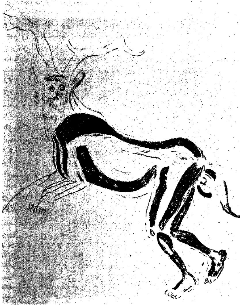
رجل يلبس جلد الحيوان الطوطمى لقبيلته .

مخطيء . ان الالهة تموت اذا لم تلق من الناس من يساعدها على الاستمرار في الحياة » . وفي احدى اساطير المازورى أيضاً نجد أحد الأرباب هناك يخاطب ربا آخر فيقول له « حين يكف الناس عن الاعتقاد فينا فاننا نموت » (٤٥) . ومجتمع الأسلاف على اية حال ليس مجتمعا منفصلا وبعيدا كل البعد عن مجتمع الأحياء وانما هو امتداد طبيعي له ، كما ان الفرد يصل اليه في مرحلة معينة من مراحل « حياته » الاجتماعية ، اذ كلما تقدم في السن اقترب من ذلك المجتمع حتى يدخله عن طريق الموت ليحتل فيه مركزاً معيناً بالنسبة لمن ظلوا على قيد الحياة . والعلاقات بين عالم الأحياء وعالم الموتى تؤلف ناحية هامة من الكوزمولوجيا البدائية نظراً للتأثير المتبادل بين العالمين ، وكذلك للتعاون المتبادل القائم على تبادل المصالح بينهما .