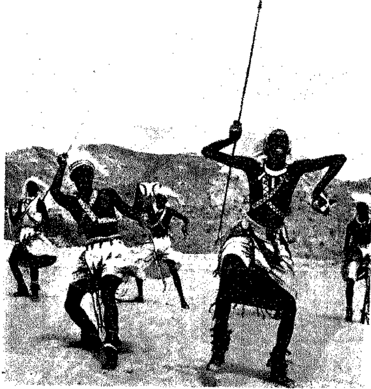
رقصة الحرب التي يمثلون فيها الهجوم على الأعداء كوسيلة سحرية لضمان النصر .

الامطار التي لا تلبث ان تتراجع خشية ان تحرقها هذه الاحجار الملتهبة وتكف بذلك عن السقوط ، وفي الوقت ذاته يقوم الناس ببعض الرقصات الشعائرية التي يأتون اثناءها بحركات معينة تهدف الى تشتيت الغمام والضباب . فكان النظام الطبيعي يمكن تحقيقه اذن بالشيء وعكسه بحسب الاحوال (٤٢) .